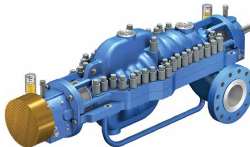
Насос CHTRa DN – 80-250 мм Q – до 715 м 3 /ч H – до 1550 м T – до 205°С p – до 155 бар

Насос CHTRa – это многоступенчатый горизонтальный насос с осевым разъемом корпуса, имеет двухзавитковую спираль корпуса, разработан в соответствии с требованиями API 610/11 и NACE для обеспечения высоких давлений и максимальной производительности. Ротор гидравлически сбалансирован посредством установкой рабочих колес «спина к спине» для уменьшения осевой силы. Насос имеет одно либо два всасывающих рабочих колеса первой ступени для достижения низких значений кавитационного запаса NPSH, опоры выполнены по центральной оси для уменьшения вибрации и термического расширения. Простая, жесткая и очень прочная конструкция обеспечивает легкое обслуживание и превосходную надежность. Обновленная гидравлическая часть и практичная конструкция позволяет легко установить насос без больших капитальных затрат.